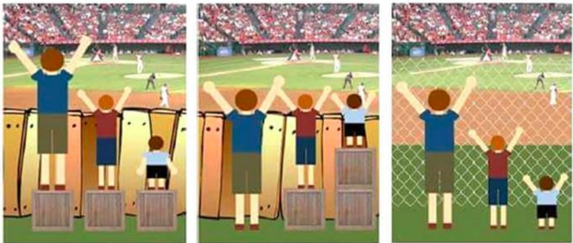
圖一：公平、平等與正義圖示

參考資料： https://www.icafoodshelf.org/blog/2017/11/15/equity-vs-equality-vs-justice-how-are-they-different