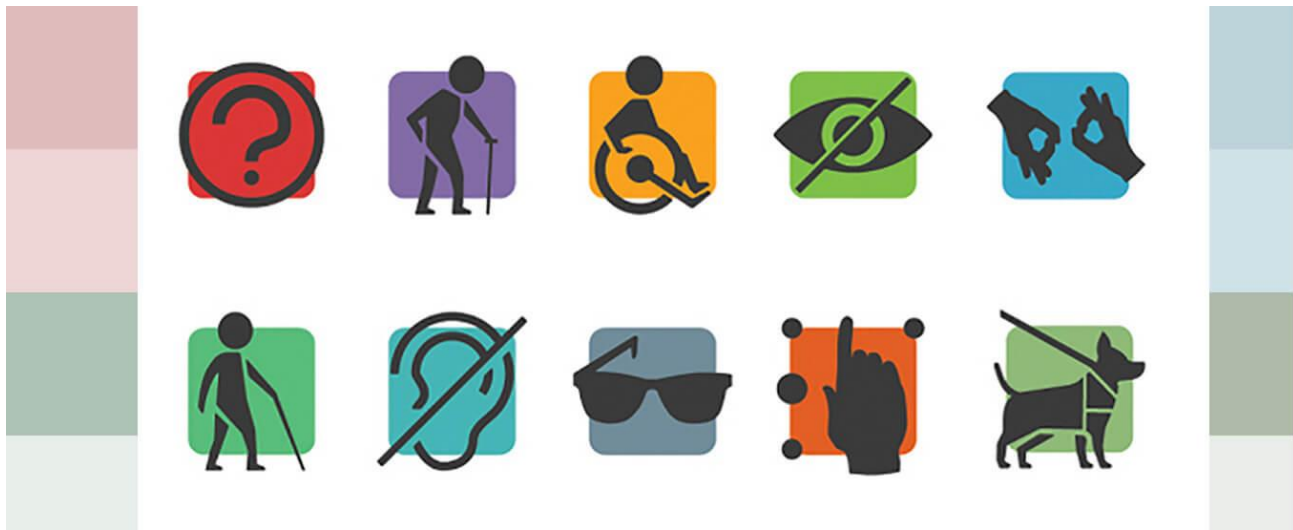
圖三：多元障礙類別圖示